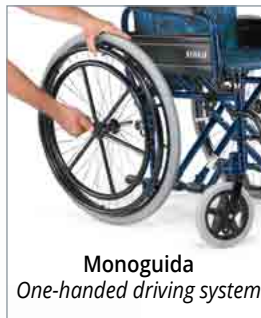
Monoguida One-handed driving system